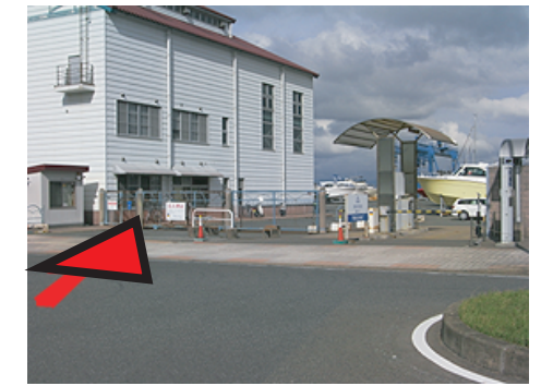
ビジター駐車場入口(手動ゲート)